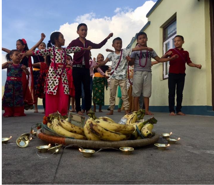
Die Gabenschale füllt sich