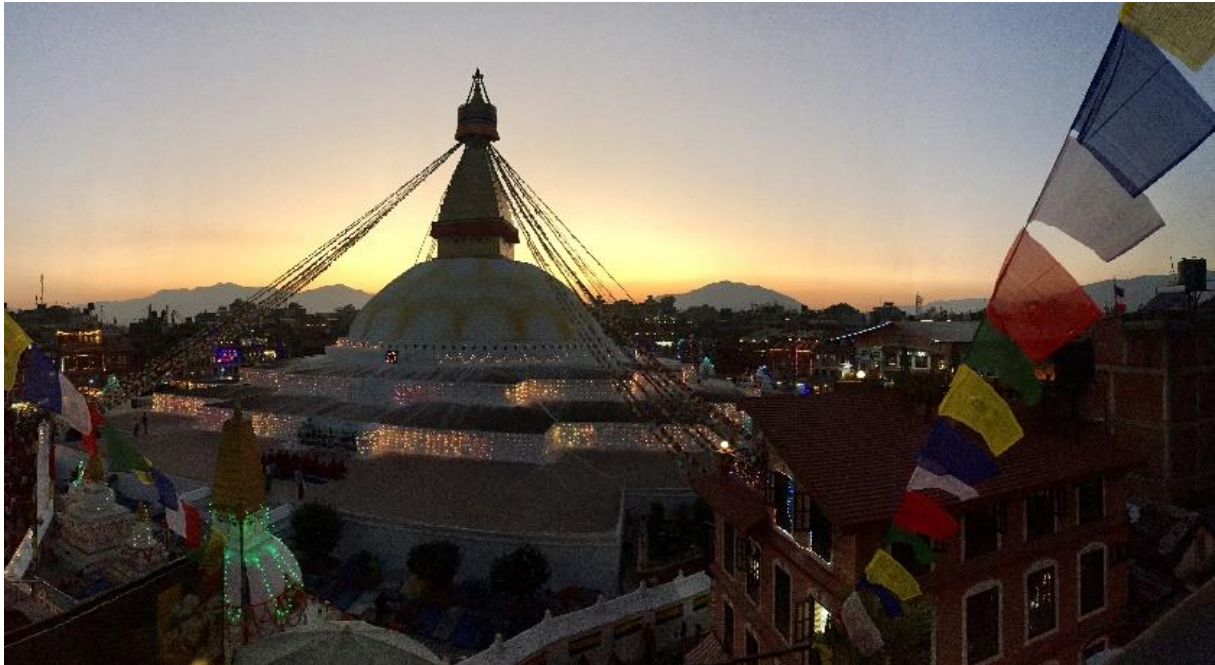
Lichterfest: stimmungsvolle Atmosphäre bei der Boudha Stupa

Das für Nepalesen zweitwichtigste Fest im Jahresverlauf, das hinduistische Tihar-Festival, fand in diesem Jahr im Oktober statt. Festgelegte unterschiedliche Riten bestimmten den Tagesablauf nepalesischer Familien über rund fünf Tage.